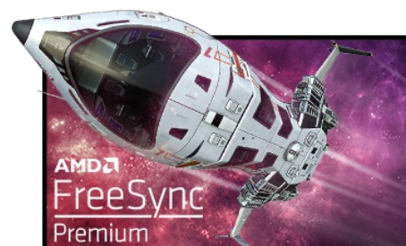
Technologie FreeSync™ Premium

La Résolution UHD (3840 x 2160), plus connu sous la dénomination 4K, vous offre une zone d'affichage gigantesque avec 4 fois plus d'espace d'information et de travail qu'un écran classique en Full HD. En raison de sa haute densité de points par pouce (DPI), il affichera des images incroyablement fines et pointues.